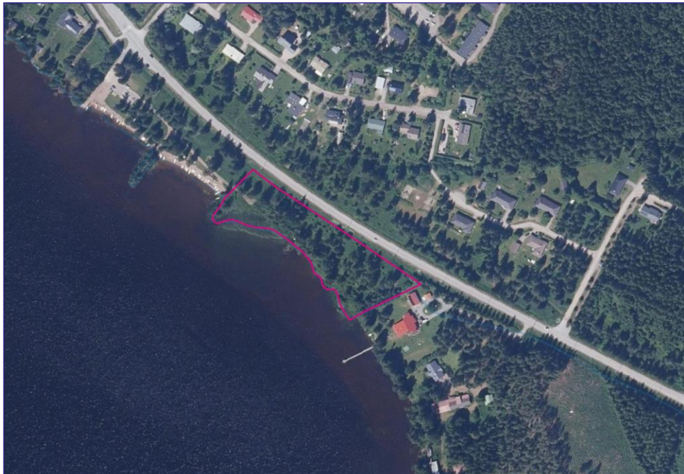
Kuva 2. Ortokuva, johon on rajattu alustava suunnittelualueen laajuus punaisella rajauksella. Sisältää Maanmittauslaitoksen ortokuva-aineistoa 9/2024, lähde: MML:n WMTS-karttakuvapalvelu 9/2024.