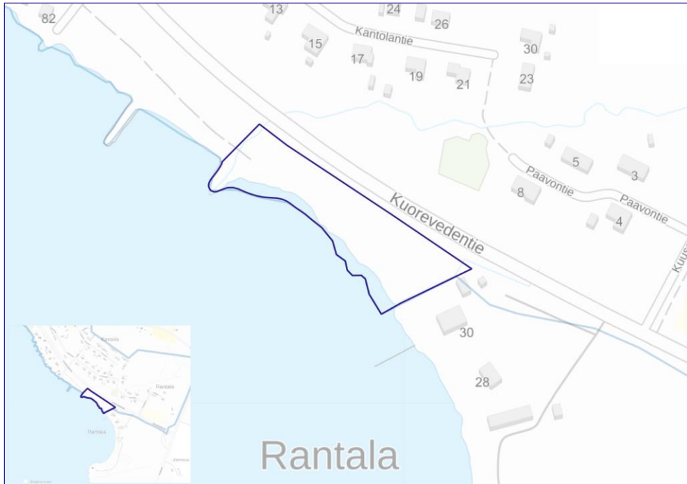
Kuva 1. Kartta, johon on rajattu alustava suunnittelualueen laajuus sinisellä rajauksella. Kartta sisältää Maanmittauslaitoksen taustakarttasarjan aineistoa, lähde: MML:n WMTS-karttakuvapalvelu 9/2024.

Kaava-alue sijaitsee Jämsän kaupungissa, Hallin taajamassa Rantatien päässä. Suunnittelualue rajoittuu idässä Eväjärvi -nimiseen vesistöön.